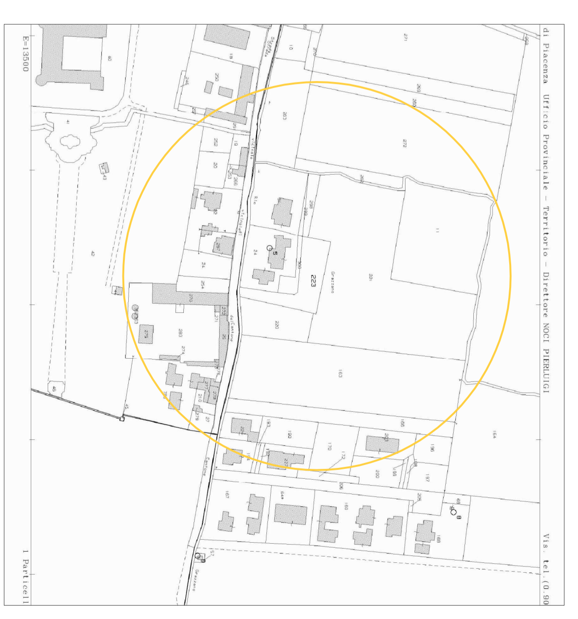
ESTRATTO P.O.C Ambito R23