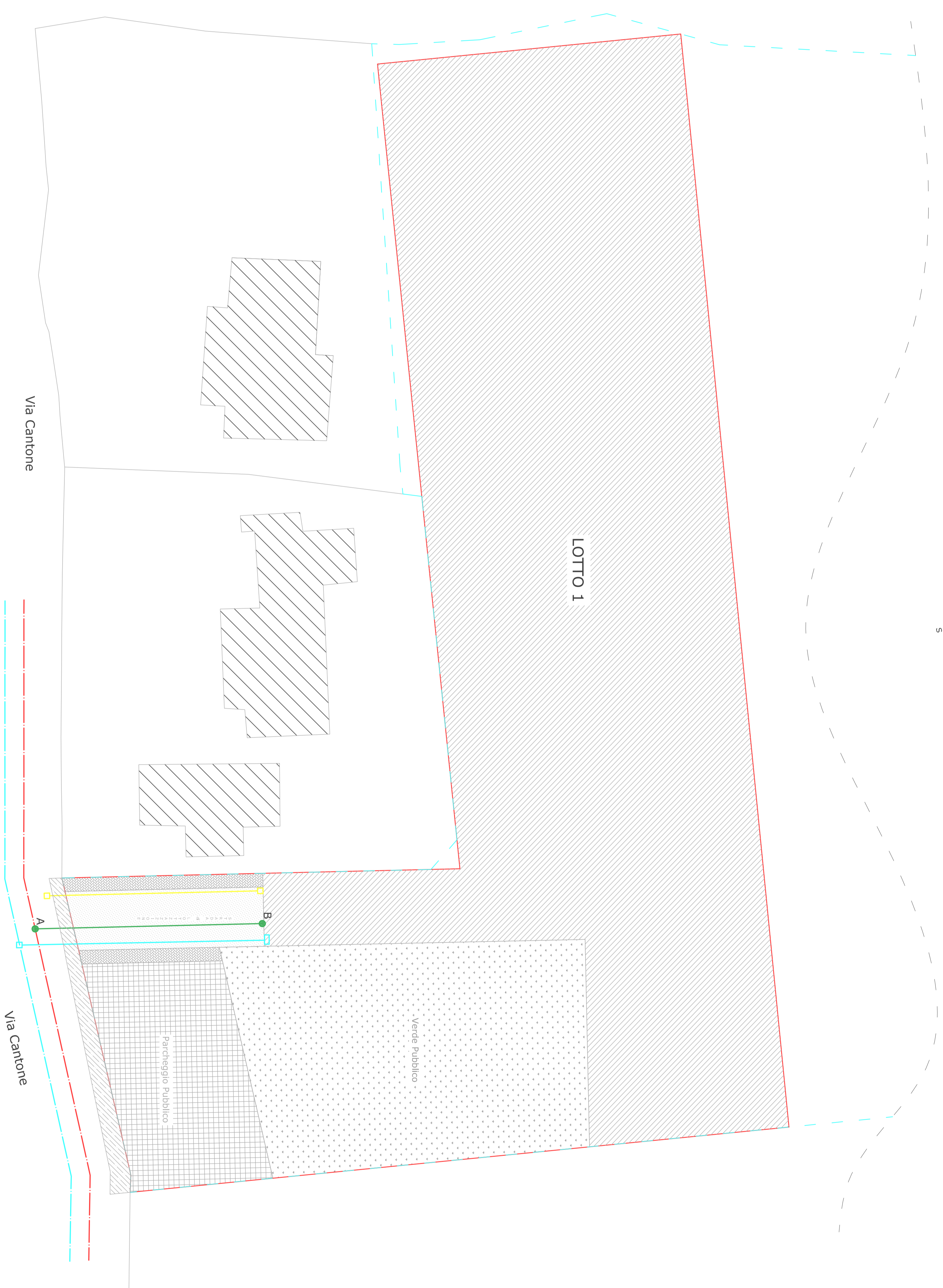
Planimetria generale scala 1:250