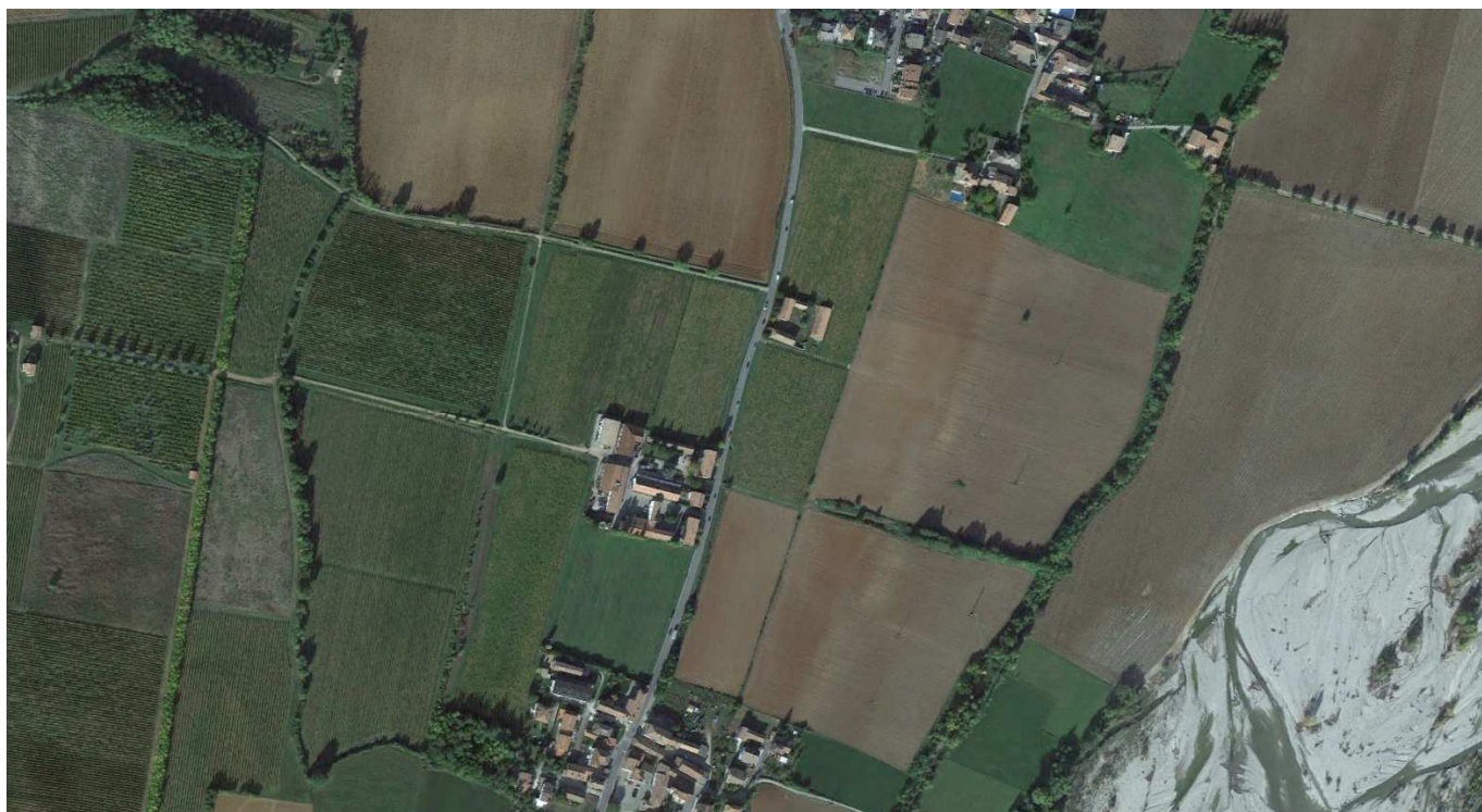
Vista aerea complessiva